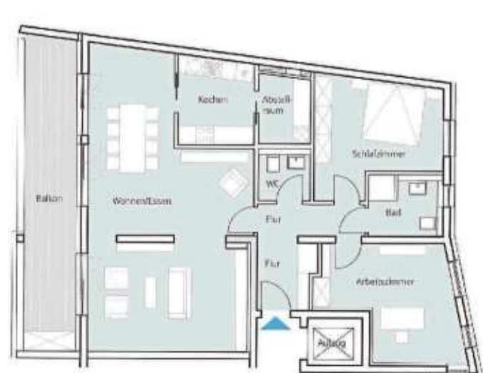
Unter anderem ist diese Wohnung (3 ZKB) mit einer Gesamtwohnfläche von 113,20 Quadratmetern in Wohnhaus 1, 3. Etage, noch zu haben.

lage fertig, so dass die künftigen Anwohner die Aussicht auf einen gepflegten Innenhof genießen können. Hier stehen auch Autostellplätze zur Verfügung, die separat erworben werden können. Wer Interesse an einem Zuhause im Herzen von Siegen hat, kann sich mit der Sparkasse Siegen unter ☎ 0271/596-1730 in Verbindung setzen oder sich vorab im Internet unter quartier-kirchweg.de/objektliste über die Immobilien informieren.