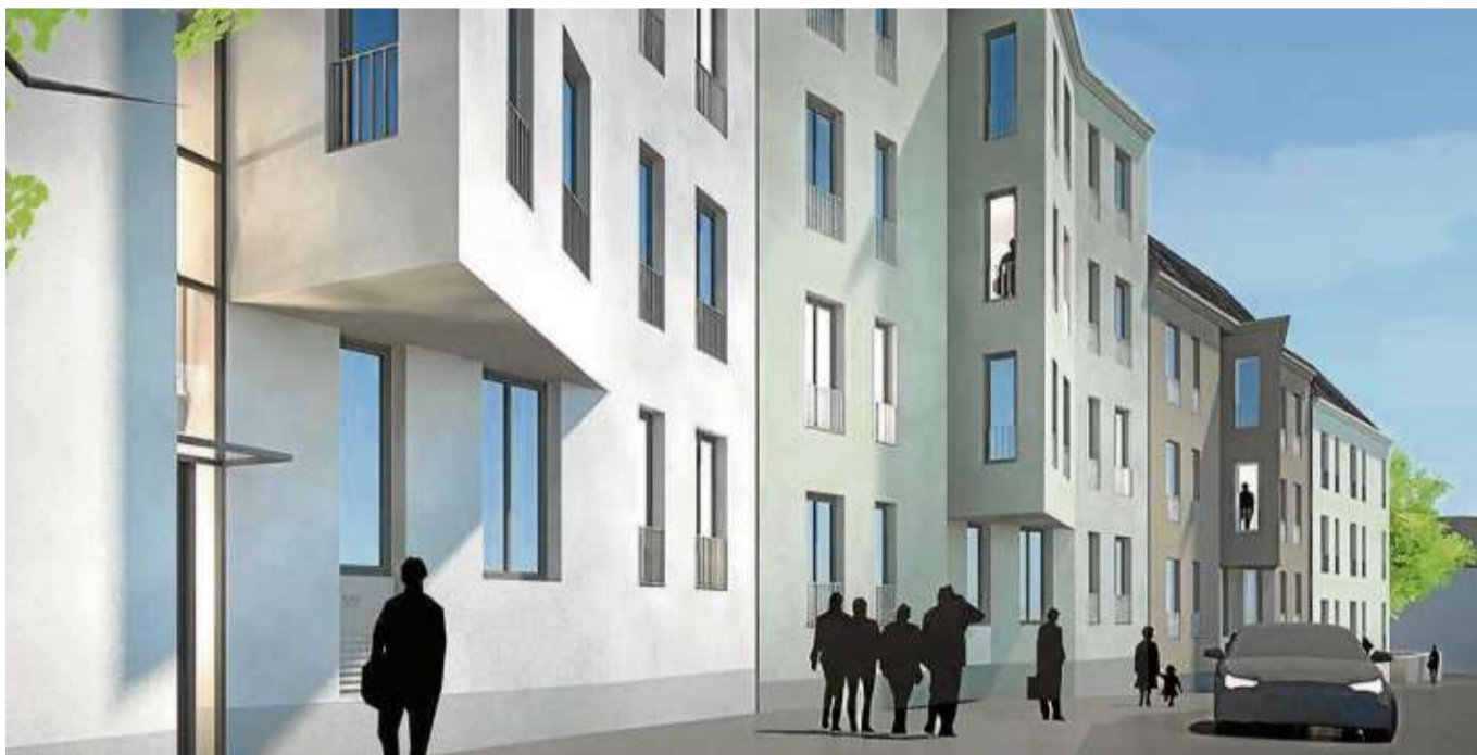
Große Fensterfronten sorgen in den unterschiedlich geschnittenen Wohnungen für lichtdurchflutete Räume.

Große Fensterfronten sorgen für lichtdurchflutete Räume und ein freundliches Ambiente, in dem sich die Eigentümer ein gemütliches Zuhause schaffen können.