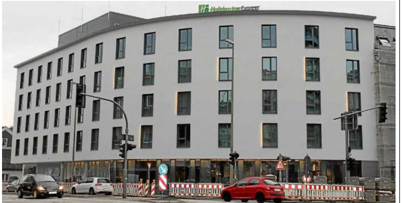
Das neue Holiday Inn Express bildet das neue Eingangstor zur Stadt Siegen: Das Drei-Sterne-Hotel befindet sich in den letzten Zügen der Vorbereitung und wird am 1. April eröffnet.

Im Eingangsbereich herrscht reges Handwerkertreiben, es riecht nach frischer Farbe, die modernen, nagelneuen Möbel und Lampen für den Lounge-Bereich sind noch von Plastikplanen bedeckt und warten auf die ersten Gäste, die Mitarbeiter werden in einer Schulung auf ihre künftigen Aufgaben vorbereitet – im Holiday Inn Express im Kirchweg läuft bereits der Countdown zur Eröffnung am 1. April.