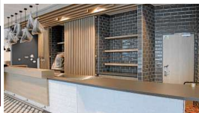
In den nächsten Tagen treten die Handwerker den Rückzug an und der Bar-Bereich kann fertig eingerichtet werden.