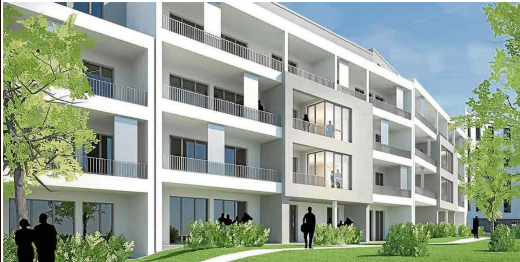
Alle Wohnungen der Anlage am Quartier Kirchweg verfügen über einen Balkon oder eine (Dach-)Terrasse, die alle zum begrünten Innenhof hin ausgerichtet sind.