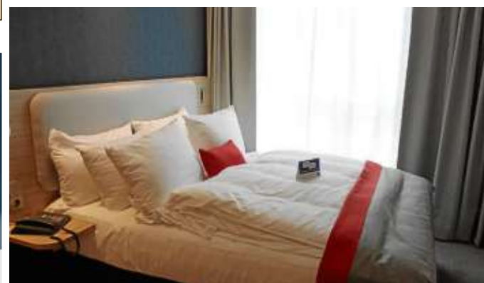
Die Hotelzimmer sind komfortabel und modern eingerichtet - vom Verkehr auf der Koblenzer Straße ist nichts zu hören.

„Wir sind hier sehr zentral gelegen, in der Nähe der Siegerlandhalle als Veranstaltung- und Tagungsort und direkt zwischen den beiden Autobahnzubringern.“ Bis zum Bahnhof und die Innenstadt sei es ebenfalls nicht weit. Die Hoteldirektorin jedenfalls zieht ein durchweg positives Fazit zum neuen „Eingangstor“ der Stadt im Kirchweg: „Es ist eine ganz besondere Ecke in Siegen geworden.“