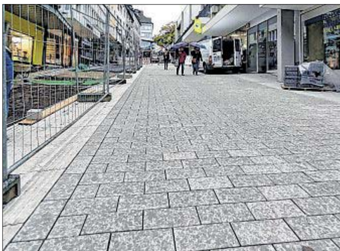
In der Kölner Straße hoch in die Siegener Oberstadt wird derzeit fleißig gearbeitet. Die neuen Pflastersteine sind bis zur Einmündung Alte Poststraße bereits größtenteils verlegt.

Auf der „Karstadt-Seite“ werden derzeit noch die letzten Pflastersteine bis zur Einmündung „Alte Poststraße“ verlegt. Sobald diese eingebaut sind, beginnen die Arbeiter mit der